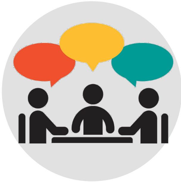
Impact Canada : 'Création conjointe'