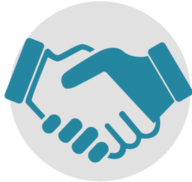
Programme de croissance propre : Partenariats de confiance