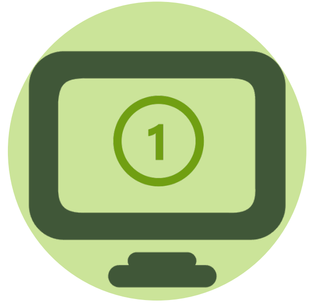
Appels de propositions communs